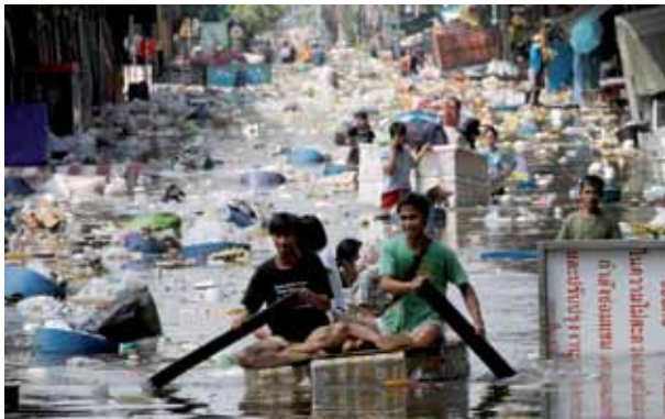
受洪水所困的人们

洪水是因过量降水、有时伴有融雪造成的自然事件。洪水的益处是带来多季收获 (孟加拉国)、持续渔业(湄公河)、灌溉 (尼罗河) 以及诸如奥卡万戈 (Okavango) 地区等湿地的生态多样性。但是,洪水可能威胁人的生命和生活,摧毁农作物、牲畜、以及房屋、工厂、道路和桥梁等基础设施。