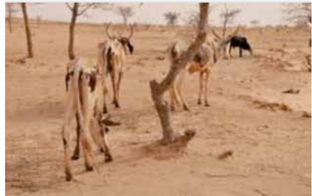
干旱对于萨赫勒游牧牧民颇具挑战。

气候服务部门可以提供一系列的工具，用于评估、监测和预测干旱，如分析主要气候因素和变异性，以规划和管理国家资源；季节预报（可以指明干旱期开始或延续的时间）；以及基于水事、农业