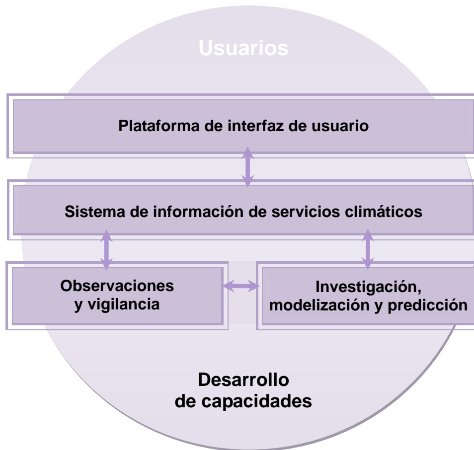
Figura 1. Componentes del Marco Mundial para los Servicios Climáticos.

Las prioridades y actividades expuestas en el presente Ejemplo representativo permitirán orientar los progresos que se realicen en los demás pilares del Marco y beneficiarse de ellos. A continuación se examina su interrelación.