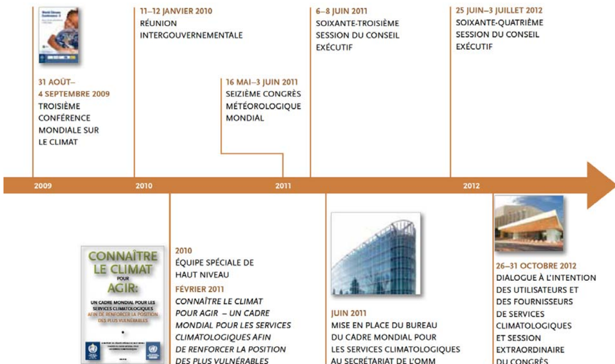
Figure 1.2: Historique du Cadre mondial pour les services climatologiques

Ce Plan présente un résumé et une liste d'activités prioritaires telles que définies par la communauté internationale au cours de l'année écoulée. Il constitue l'aboutissement d'un vaste processus de consultation couvrant les différentes composantes fonctionnelles du Cadre mondial. Plus de 300 experts internationaux ont participé au projet et plus de 60 pays ont fait l'objet d'études de cas ( http://www.wmo.int/pages/gfcs/consultations_en.php ). Ce savoir collectif a été résumé dans une synthèse présentée dans cinq annexes, une par composante fonctionnelle (ou pilier), et quatre exemples représentatifs, un par domaine prioritaire. Les annexes décrivent les besoins à satisfaire dans le contexte mondial actuel pour atteindre les objectifs fixés par le Cadre mondial, ainsi que les activités prioritaires à mener pour obtenir les résultats attendus. Les exemples représentatifs ont permis aux organisations chefs de file dans les différents domaines prioritaires d'exposer leur point de vue quant aux éléments à mettre en place en vue de la réalisation des promesses du Cadre mondial.