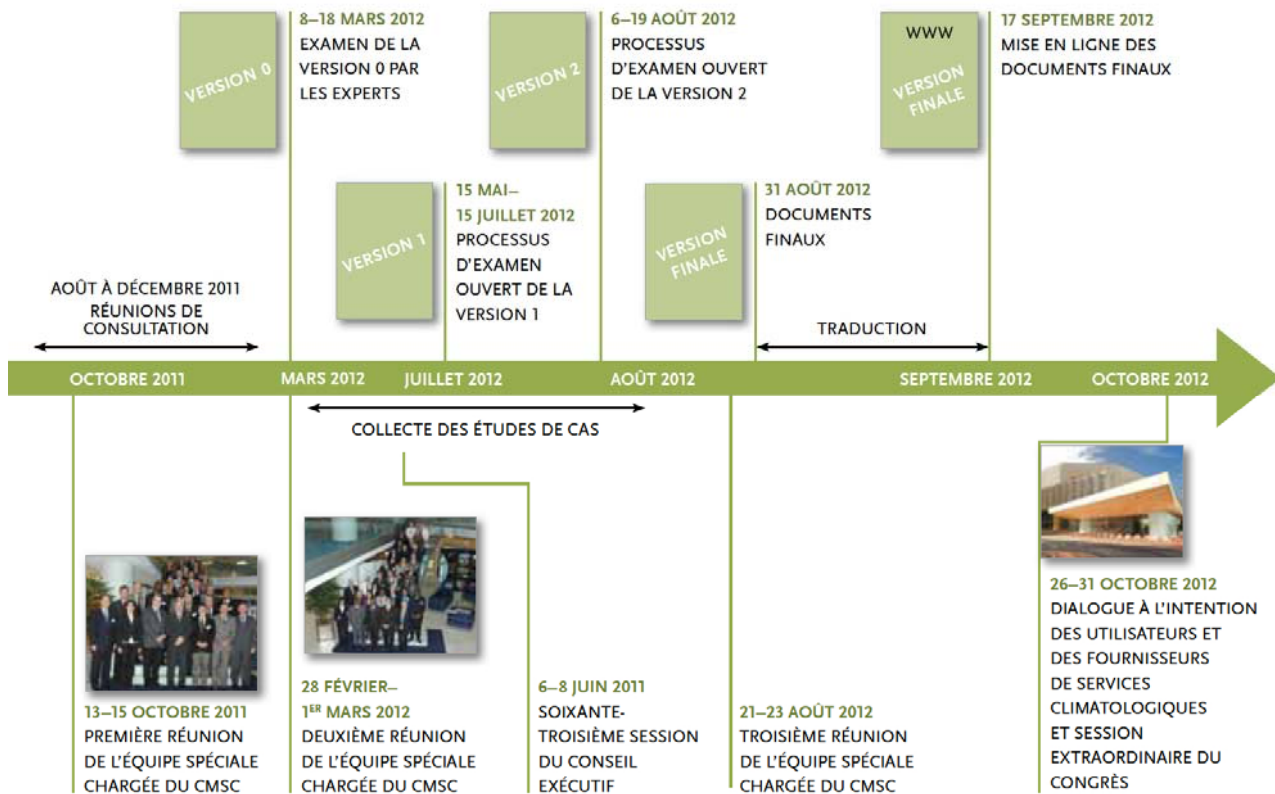
Figure 1.1: Processus d'élaboration du Plan de mise en œuvre présenté à la session extraordinaire du Congrès météorologique mondial en octobre 2012.

Le Cadre mondial ne constitue pas une nouvelle entité dont la mission serait de fournir des services climatologiques. Il s'agit plutôt d'un mécanisme d'appui destiné à élaborer, promouvoir et coordonner des services climatologiques opérationnels là où le besoin s'en fait sentir. Il établit une passerelle entre les fournisseurs et les utilisateurs de services climatologiques et veille à ce que les investissements et initiatives passés et à venir soient pleinement exploités. Dans un premier temps, les actions du Cadre mondial se concentreront essentiellement sur les résultats à atteindre dans quatre domaines prioritaires, à savoir la réduction des risques de catastrophes, le renforcement de la sécurité alimentaire, l'amélioration de la santé et la promotion d'une meilleure gestion de l'eau. Ce sont en effet ces domaines qui offrent le plus de perspectives immédiates en matière de prise de décisions, et ce à tous les niveaux, et de possibilités de retombées positives sur la sécurité et le bien-être des populations. Puis, au fur et à mesure de la mise en œuvre du Cadre mondial, on pourra s'intéresser à d'autres secteurs, comme l'énergie et les transports, et définir les résultats à atteindre.